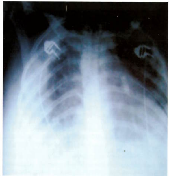
B – Radiografia do tórax

Puérpera de 24 anos de idade internada por febre, dor torácica pleurítica, tosse seca, anemia e insuficiência cardíaca congestiva. Apresentava sopro cardíaco com frémito palpável, esplenomegália e petéquias generalizadas. Tinha sido submetida duas semanas antes a uma curetagem. As imagens acima representam o ecocardiograma transtorácico (A) e a radiografia do tórax anteroposterior (B).